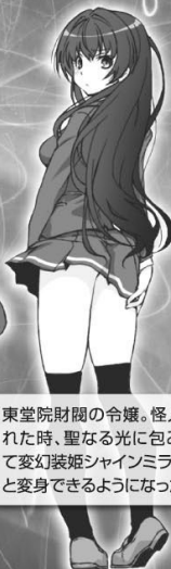
東堂院紗姫 とうどういんさき

東堂院財閥の令嬢。怪人に襲われた時、聖なる光に包み込まれて変幻装姫シャインミラーージュへと変身できるようになった。