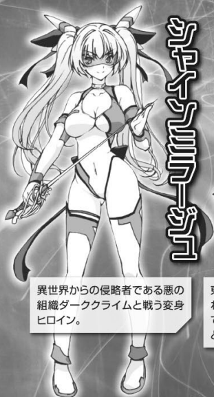
シャインミラーージュ