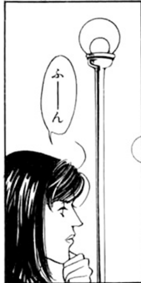
美紅さん大学4年になった。