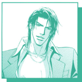
YAIZU BROTHERS, FUCKIN' COOL!!! 2