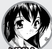
しんすおとの 清水音羽