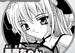
あくまの 悪魔ちゃん (リーヴア・アイス)

魔王を探して人間界にやってきた 強気な悪魔。魔力補給のエサとして 勝之介に接近する。