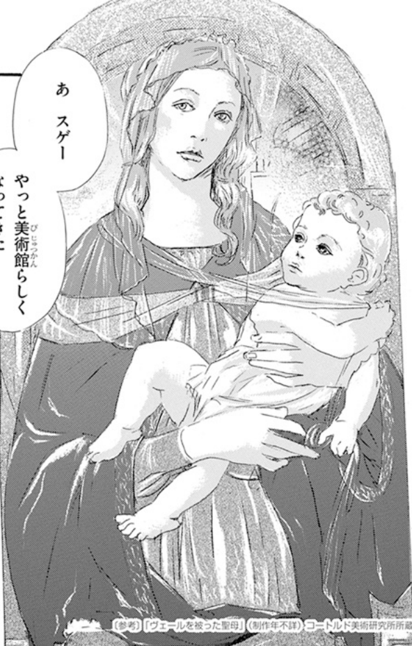
21. ヴェールを被った聖母