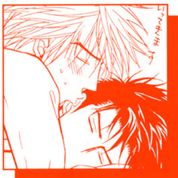
PLAY BOY BLUES 2