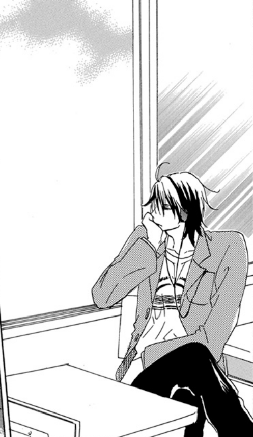
そしてこちには壁々とサボり中...