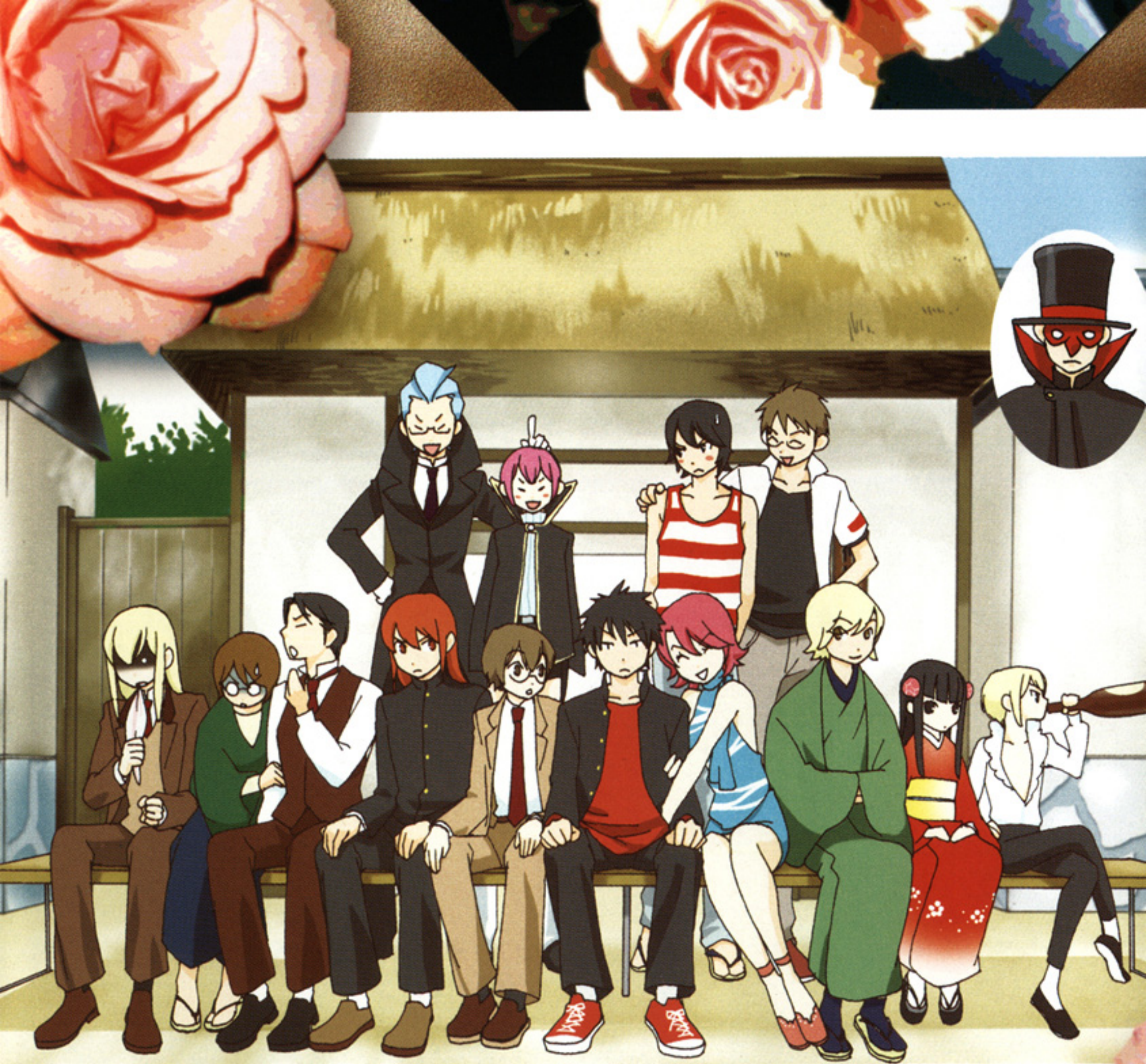
平成17年7月 仲神邸前にて