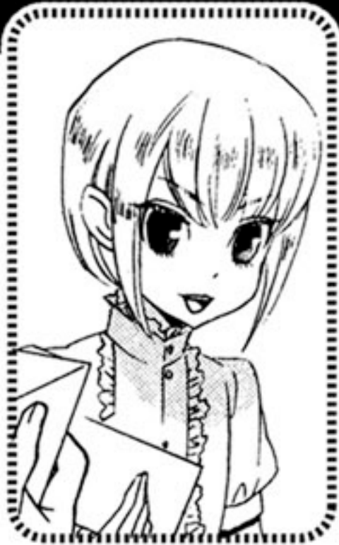
なかがみ みつほ 仲神美鶴

本家仲神家の先代当主。一見少年の様に見えるが結構いい年。年長者らしく、落ち着いた考えの持ち主。