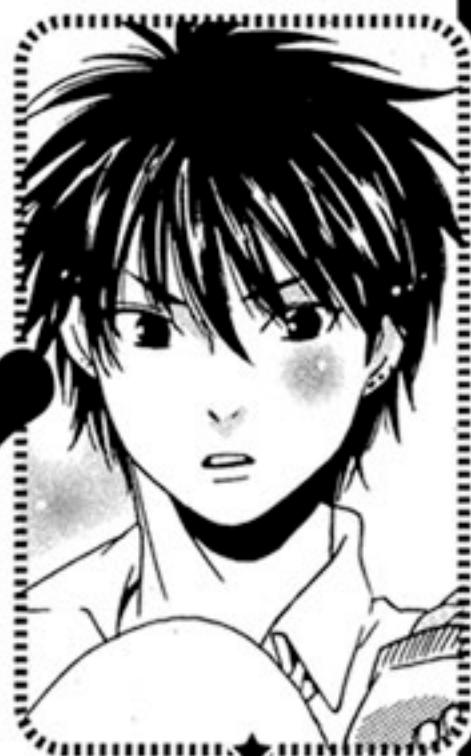
いじま はるか 飯島永

本作品の主人公二人。(のはず)朱鷺緒は教師、永はその教え子であるが、二人は恋仲である。最近、とんと影が薄い。