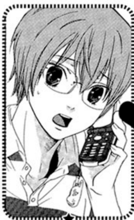
なかがみ ときお 仲神朱鷺緒

利鎌島の事件をきっかけに恋人同士になった二人。雪は仲神家に居候しながら、ひばりの秘書を務める。