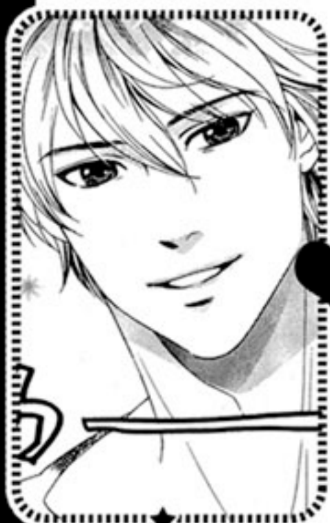
いまいずみ きよし 忌泉雪

仲神家長男。職業は少女漫画家。趣味は女装だが、本人はノーマルと言い張っている。心は乙女そのもの。