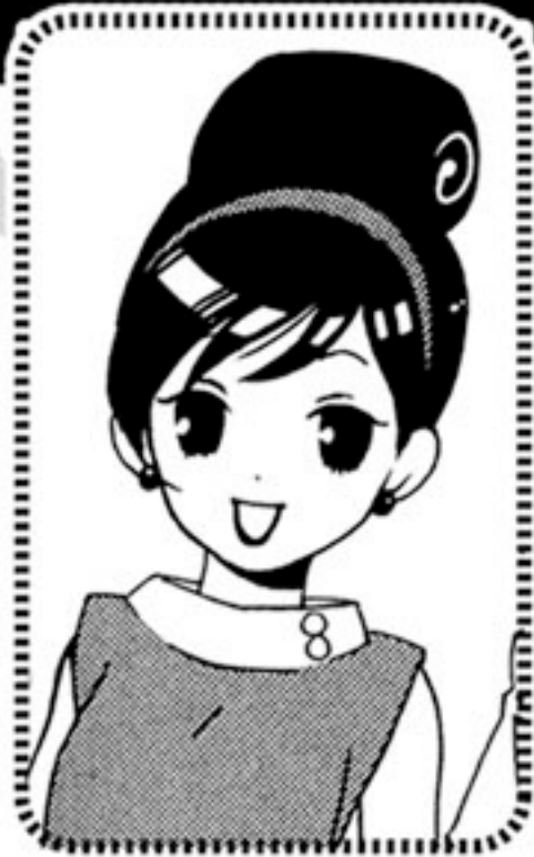
なかがみ すずめ 仲神雀

本家仲神家の先代当主。一見少年の様に見えるが結構いい年。年長者らしく、落ち着いた考えの持ち主。