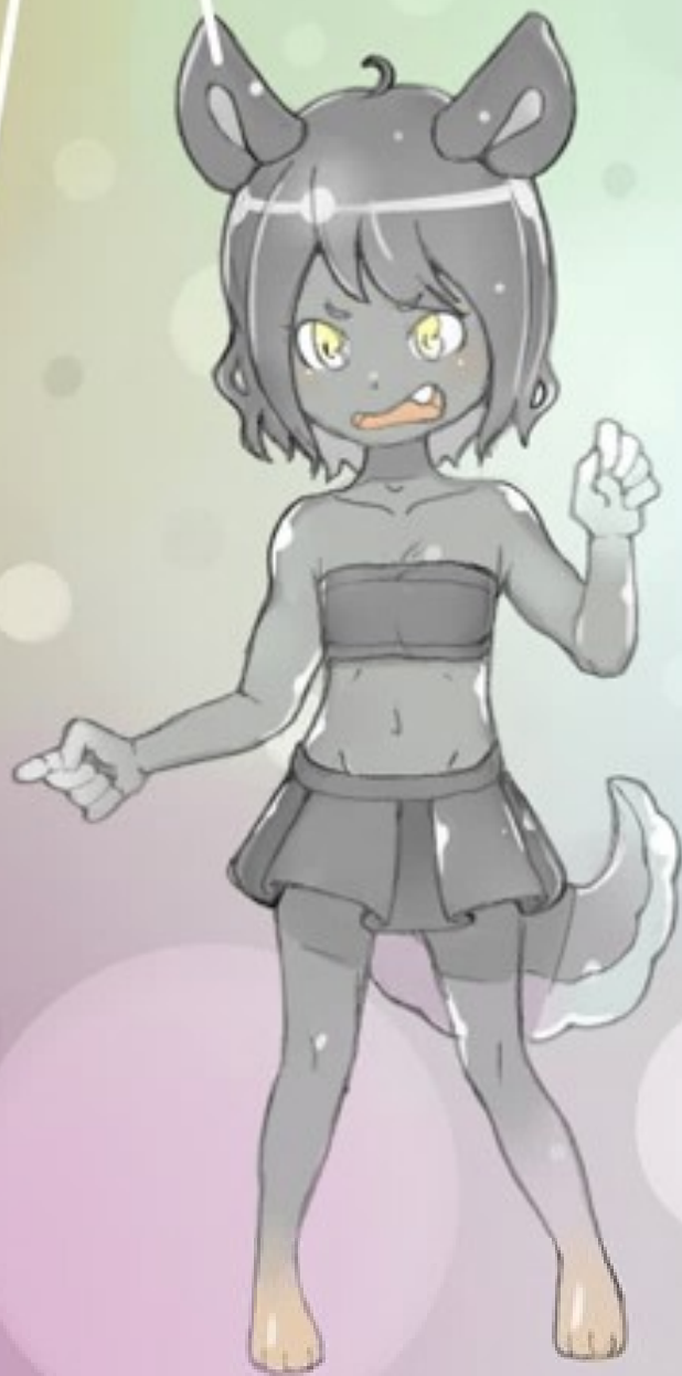
<バティ> オオカミの女の子