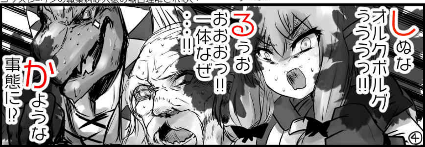
ゴブスレ=サンの職業病は大抵の場合理解されない