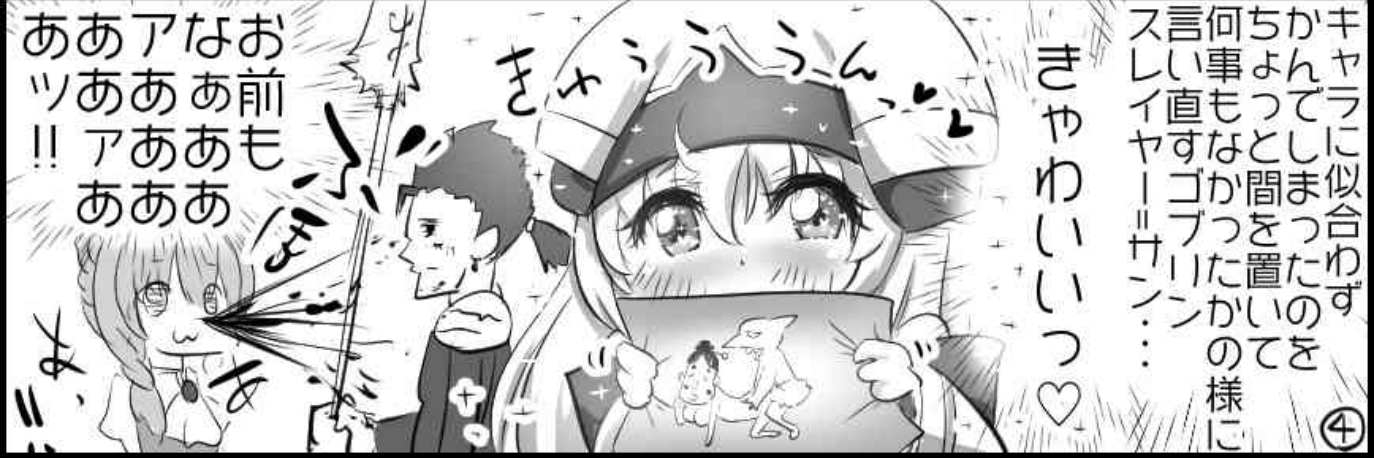
受付のお姉さんは視界の端でいつも2人を見守ってる ← もろびとでまわっている