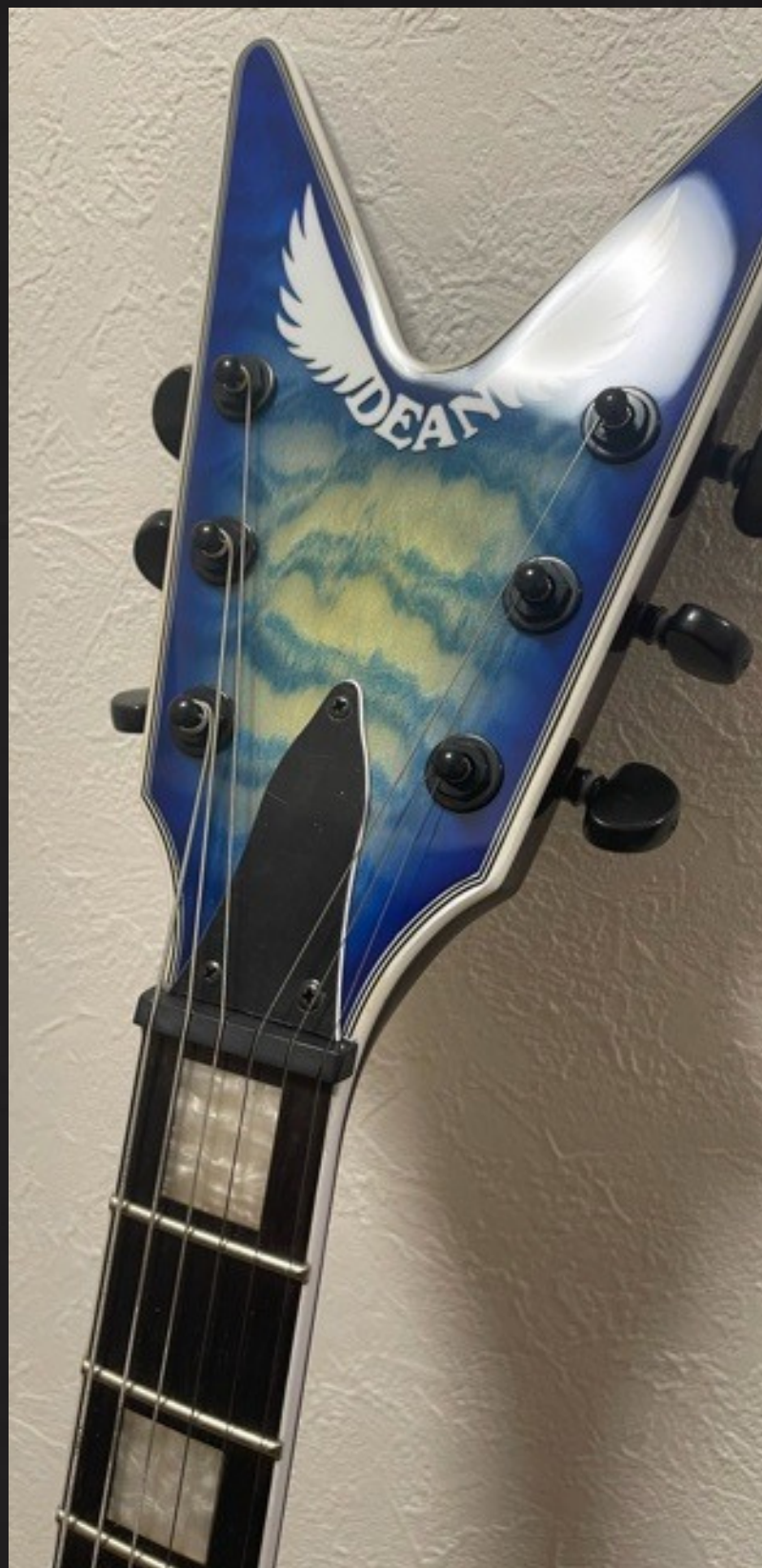
Dean Blue Ocean

「異空要塞セクロス」も、DeanのBlue Oceanを使った。考え方は「運命の戦士」と同じ。キーボードの手前じゃなくて、キーボードの裏側で柔らかく包むようなアプローチをするときに、Deanを利用する。Deanはデスメタル系のギタリストが良く使ってるけど、音圧があるんだよね。かつ、低音の「デスボーカル」を邪魔しない。