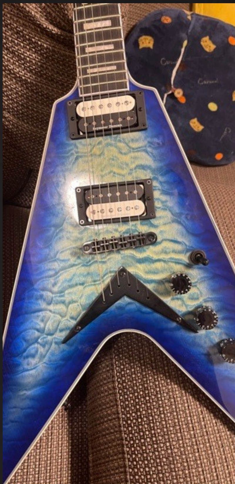
Dean Blue Ocean