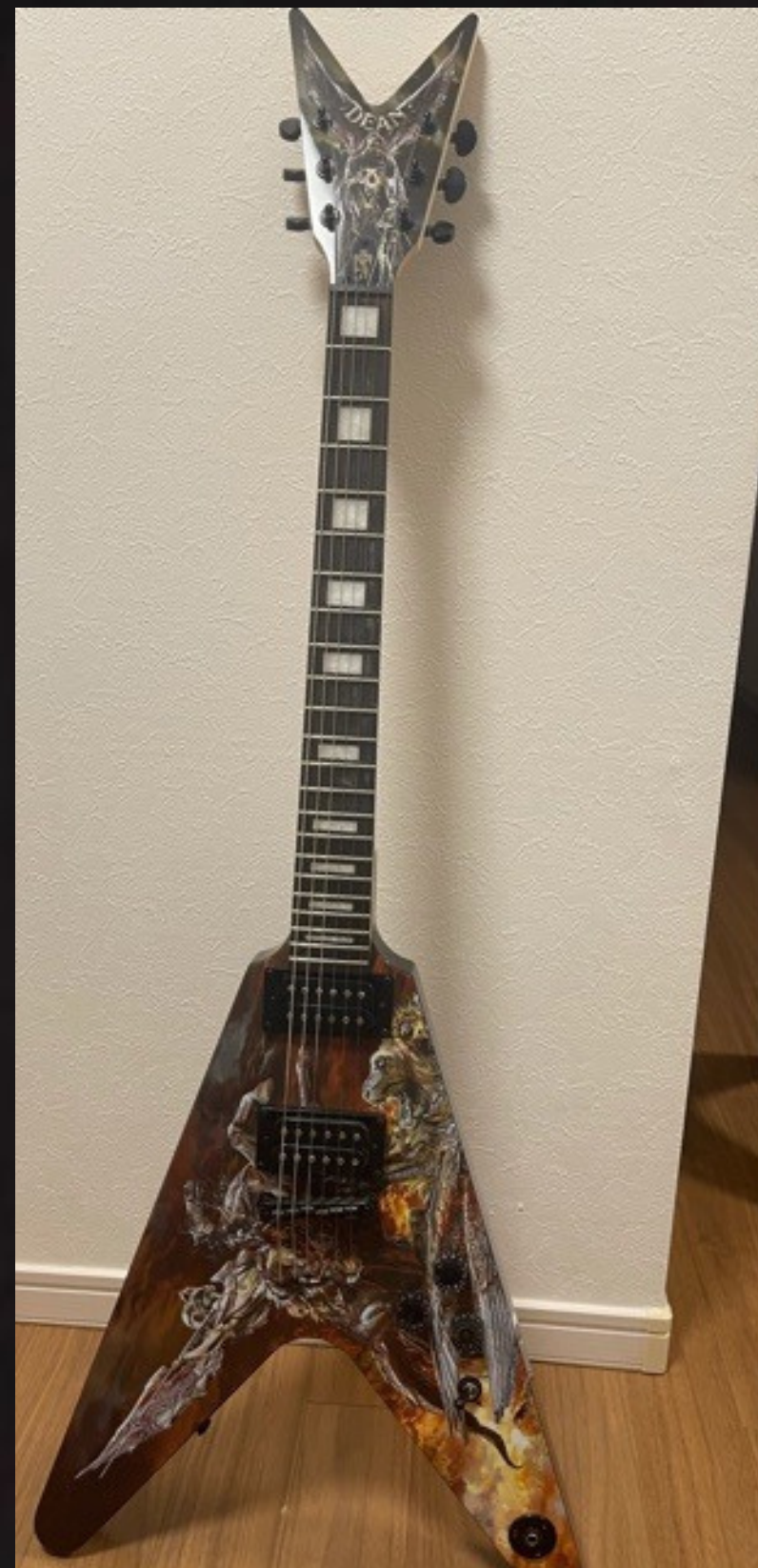
Dean HUNTER V

わりと、色んな曲にハマりやすいのが、ミッキーが騙されて10万円で購入した、定価3万円のHUNTER Vだ。バスウッド材を使った、超安物ギターなんだけど、最高なんだ。シグネチャーモデルだから安物でも、狙った音にしてるのかもしれないけど。