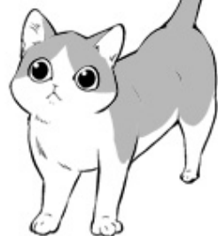
我が家に 来た頃の タバサの 重さは 約1kg