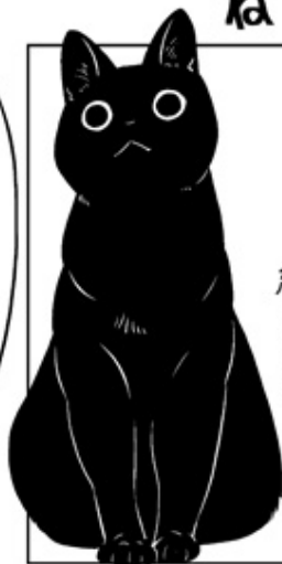
マタムネくんは 約6kg