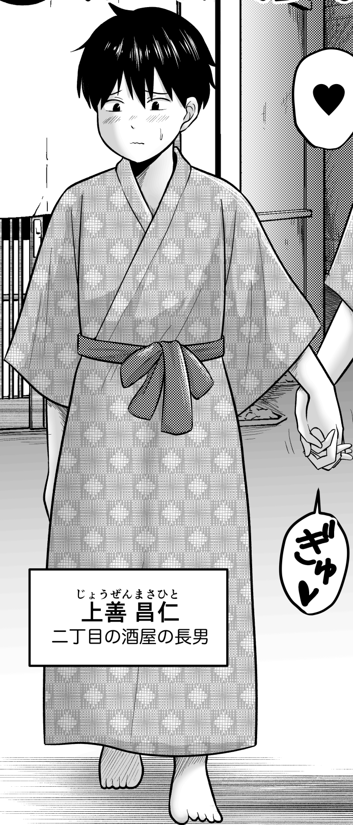
じょうぜんまさひと 上善 昌仁 二丁目の酒屋の長男