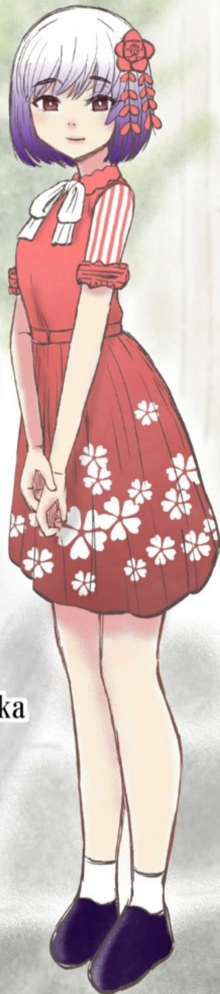
AIアイドルsayaka # 1 『ガス抜き』