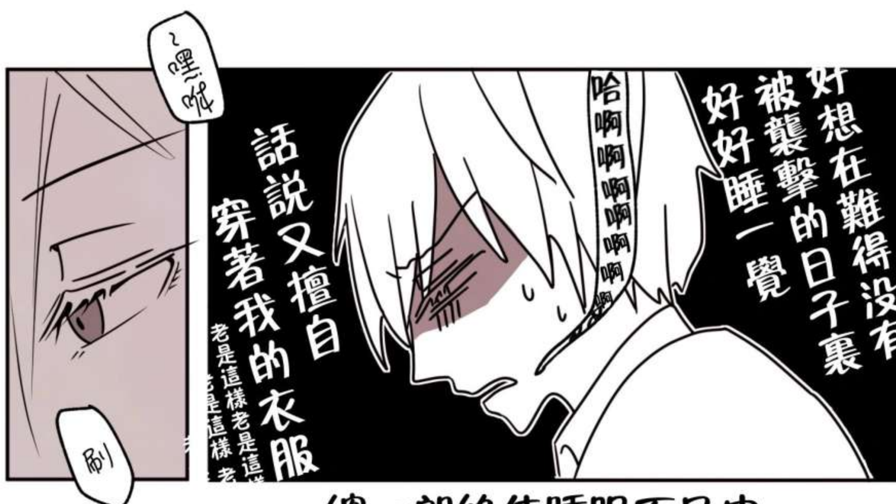
總一郎絕佳睡眠不足中