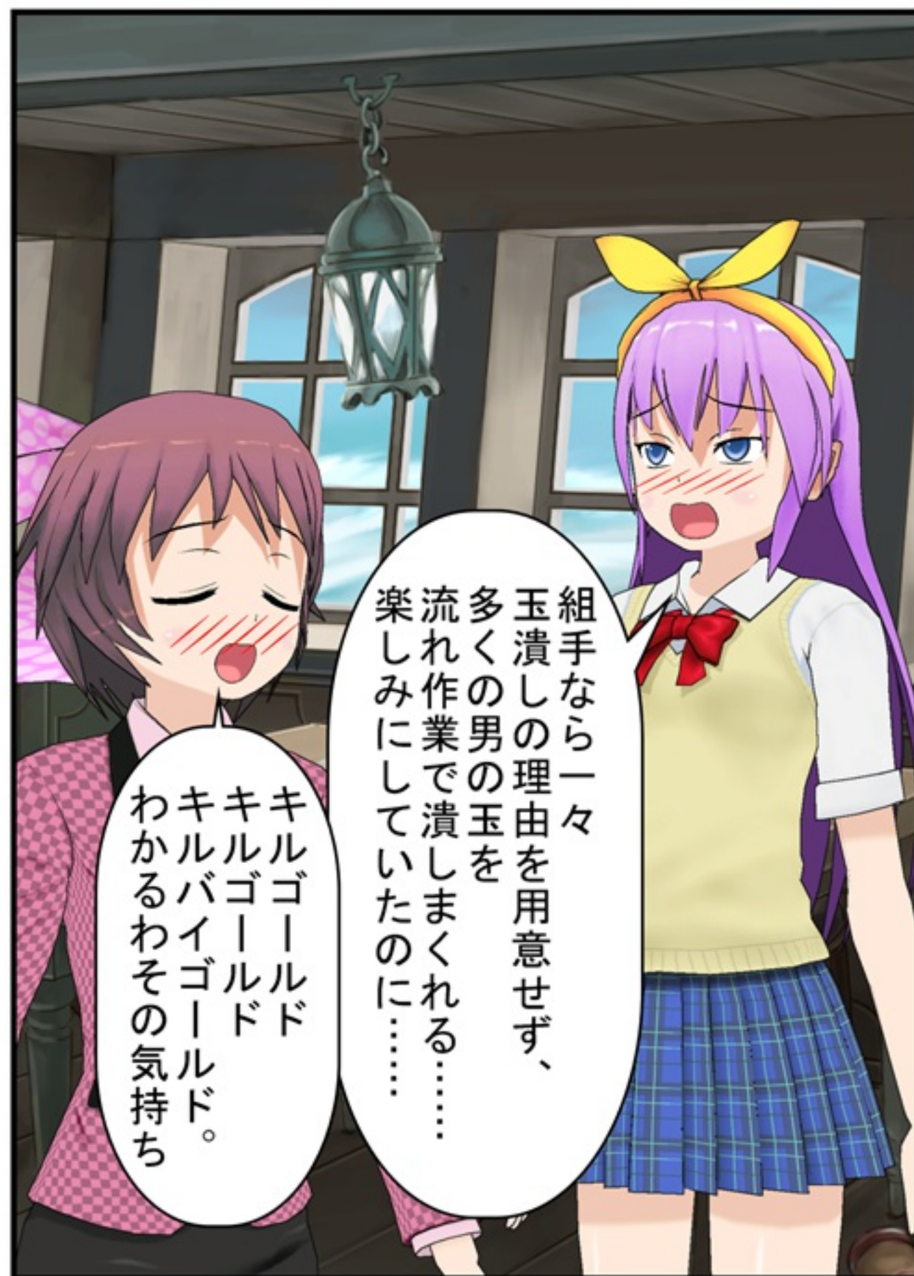
50人の空手部員のうち 合宿一番の楽しみは玉潰し。 という猛者は5人もいない。